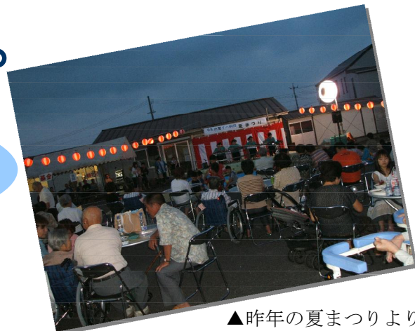
▲昨年の夏まつりより

※ステージ企画や出店、ゲームなど患者様も地域のみなさまにも楽しんでいただける企画を実行委員会で相談中です。アイデア・提案などお寄せください。